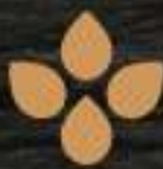
(10) GRANOS DE SÉSAMO