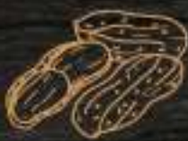
(7) FRUTOS DE CÁSCARA