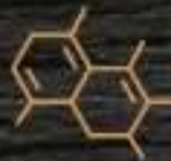
(11) DIÓXIDO DE AZUFRE Y SULFITOS